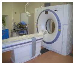
CT 検査 (単純・造影)